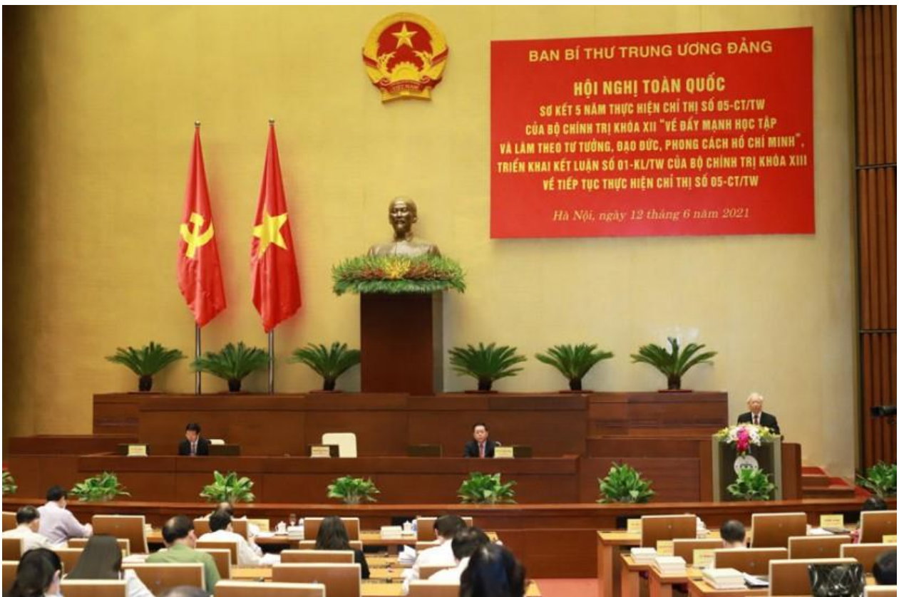
Hội nghị trực tuyến toàn quốc nghiên cứu, học tập chuyên đề toàn khóa về "Học tập và làm theo tư tưởng, đạo đức, phong cách Hồ Chí Minh" nhiệm kỳ Đại hội XIII của Đảng, chuyên đề năm 2021.

Dù ở vị trí công tác nào, mỗi cán bộ lãnh đạo, quản lý phải không ngừng tu dưỡng, rèn luyện để nâng cao uy tín trước Đảng, trước nhân dân. Đồng thời, cán bộ lãnh đạo, quản lý phải luôn nghiêm khắc với bản thân, thực hiện tự phê bình nghiêm túc, tự giác để phát hiện và thông báo với tập thể những hạn chế, yếu kém, nhất là trong công tác lãnh đạo, chỉ đạo, quản lý, điều hành để tìm ra phương hướng, kế hoạch khắc phục.