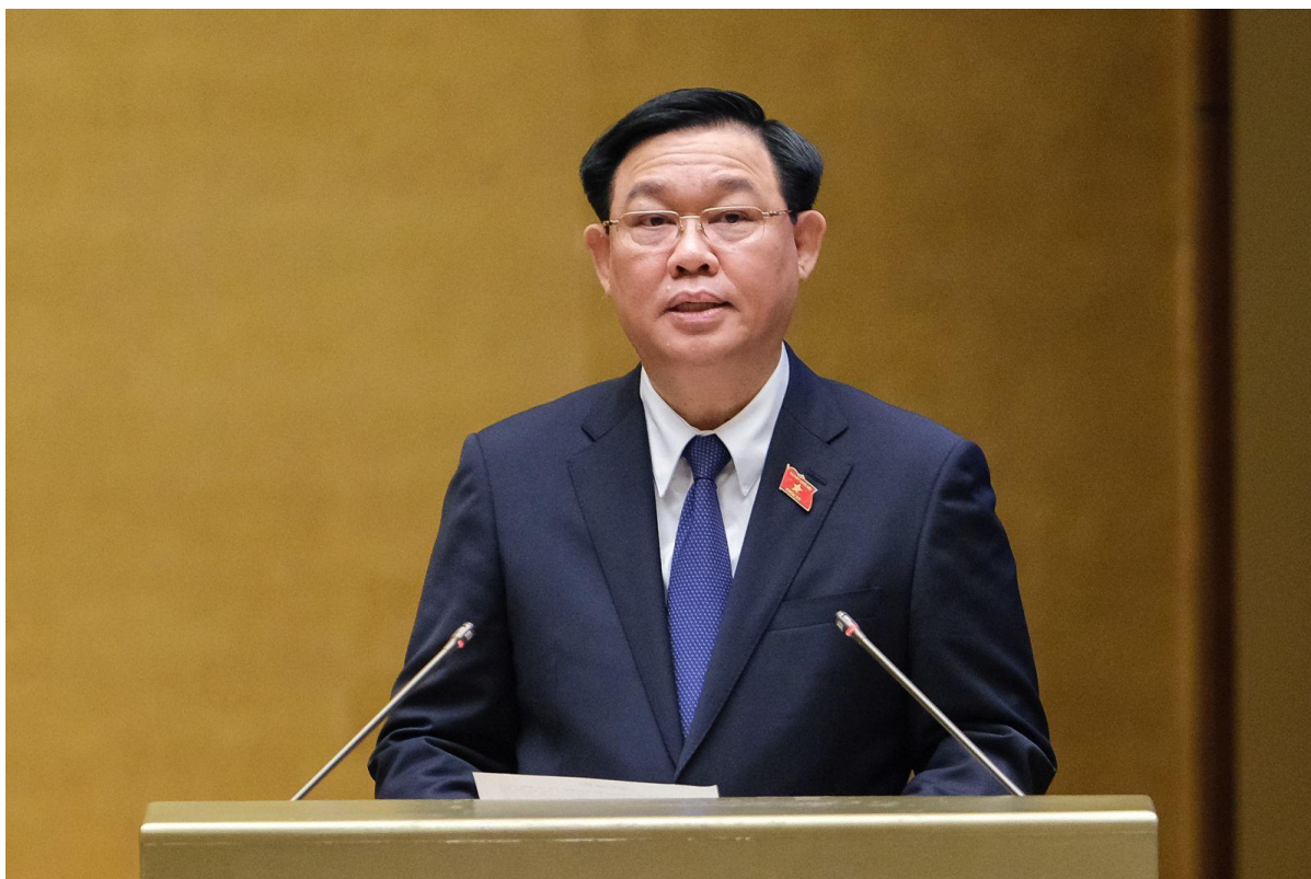
Đồng chí Vương Đình Huệ, Chủ tịch Quốc hội phát biểu khai mạc kỳ họp.

Chủ tịch Quốc hội cho biết, thực hiện các Kết luận của Trung ương, Nghị quyết của Quốc hội, Chính phủ về thích ứng linh hoạt, an toàn, kiểm soát hiệu quả dịch COVID-19 và các giải pháp tiền tệ, tài chính, hỗ trợ, phục hồi kinh tế-xã hội, cho đến nay, sau khi cơ bản kiểm soát được dịch COVID-19, tình hình kinh tế-xã hội nước ta đã có chuyển biến rất tích cực. Kinh tế Việt Nam đang phục hồi và phát triển rõ nét; nhiều ngành, lĩnh vực đang vươn lên mạnh mẽ và lấy lại đà tăng trưởng, lạm phát được kiểm soát, kinh tế vĩ mô và các cân đối lớn được bảo đảm. Hoạt động giáo dục, đào tạo, văn hóa, xã hội, y tế, thể thao... cơ bản đã trở lại bình thường; an sinh xã hội tiếp tục được chú trọng, quốc phòng, an ninh, trật tự, an toàn xã hội, độc lập, chủ quyền, thống nhất toàn vẹn lãnh thổ được giữ vững. Hoạt động đối ngoại không ngừng được mở rộng, góp phần nâng cao uy tín và vị thế của Việt Nam trên trường quốc tế. Chủ tịch Quốc hội ghi nhận, thành công vang dội của Đại hội thể thao Đông Nam Á SEA Games 31, ngày hội của tinh thần đoàn kết Đông Nam Á, đặc biệt là thành tích đặc biệt xuất sắc bảo vệ thành công ngôi vô địch của cả bóng đá nam và bóng đá nữ Việt Nam.