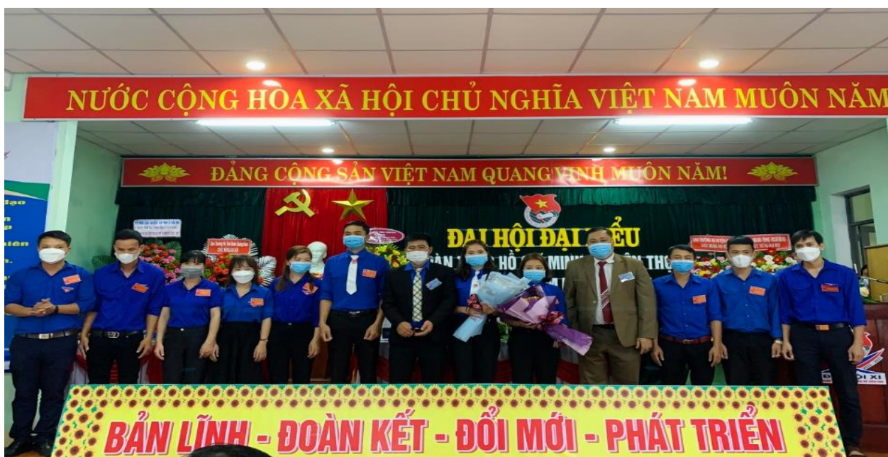
Đại hội điển Đoàn TNCS Hồ Chí Minh xã Tiên Thọ, huyện Tiên Phước

Để công tác chỉ đạo Đại hội Đoàn cấp cơ sở đạt hiệu quả cao, Ban Thường vụ Tỉnh đoàn đã bám sát các văn bản hướng dẫn của Trung ương Đoàn, chủ động xây dựng và ban hành sớm kế hoạch, hướng dẫn tổ chức Đại hội đến 100% các cơ sở đoàn trong toàn tỉnh; lựa chọn 04 đơn vị Đoàn cấp cơ sở để chỉ đạo tổ chức Đại hội điển. Đồng thời, thành lập các Tổ công tác chỉ đạo Đại hội điển, thường xuyên bám sát cơ sở, trực tiếp làm việc, kiểm tra nắm bắt tình hình để kịp thời tháo gỡ những khó khăn, vướng mắc trong quá trình chuẩn bị, đảm bảo Đại hội được tổ chức theo đúng yêu cầu, chất lượng và hiệu quả.