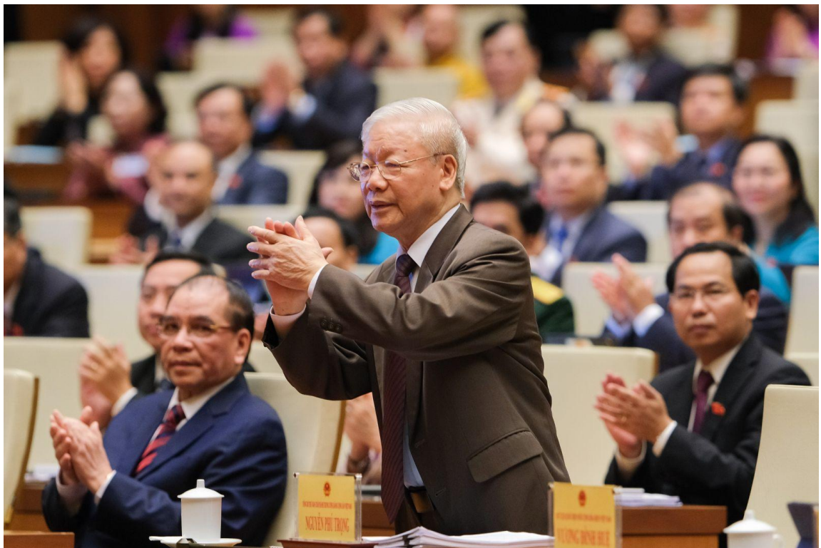
Tổng Bí thư Nguyễn Phú Trọng dự phiên khai mạc Kỳ họp thứ 3, Quốc hội khóa XV.

Kỳ họp thứ 3 Quốc hội khóa XV diễn ra theo hình thức họp tập trung cả kỳ, sau 2 năm do tác động của đại dịch COVID-19 nhiều kỳ họp của Quốc hội đã phải tổ chức theo hình thức trực tuyến, trực tuyến kết hợp trực tiếp. Dự kiến Kỳ họp thứ 3, Quốc hội khóa XV diễn ra trong 19 ngày làm việc từ ngày 23/5 đến ngày 16/6/2022.